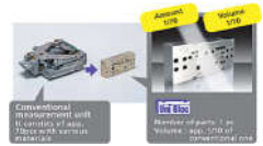
傳統感應器 Uni Bloc感應器